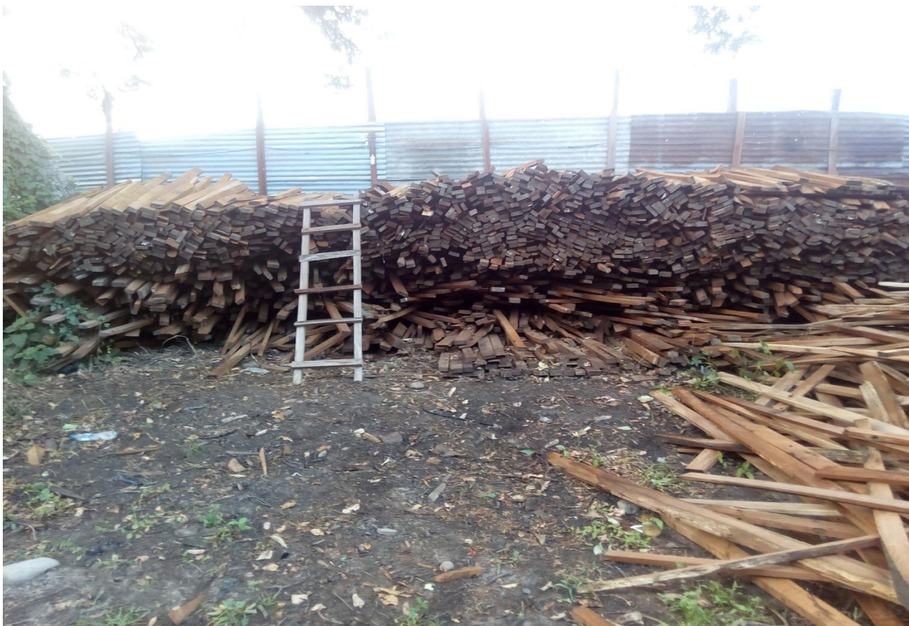
डिपोमा रहेको बाकल दाउराको अवस्था